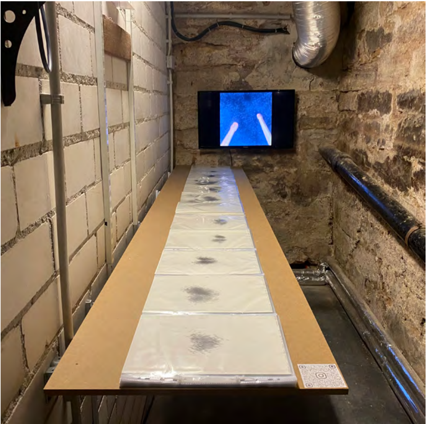
AUSSTELLUNGSANSICHT KUNSTRAUM 34 STUTT GART, 2023