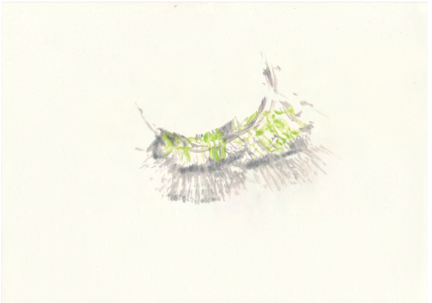
MICHELIN KOBER • AUGENBLICK VERWEILE DOCH • Atelier 8.5.2012 Bleistift, Buntstift auf Büttenpapier • 20 x 30 cm