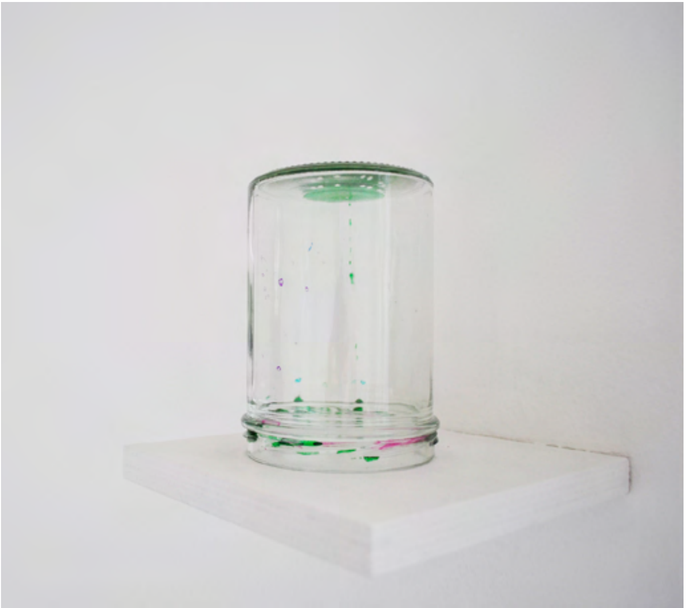
MICHELIN KOBER • AUGENBLICK VERWEILE DOCH Ausstellungsansicht Atelierhaus Wilhelmstrasse, 2012