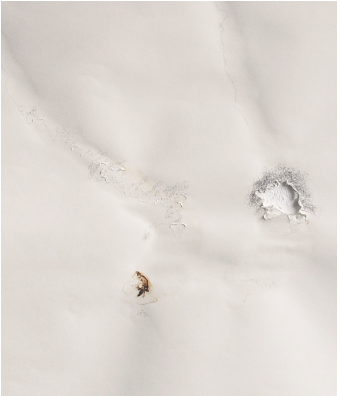
MICHELIN KOBER • LANGSAM REICHT'S • 2003/2012 Schneckenschleim, Bleistift auf Papier • 70 × 100 cm, Detail