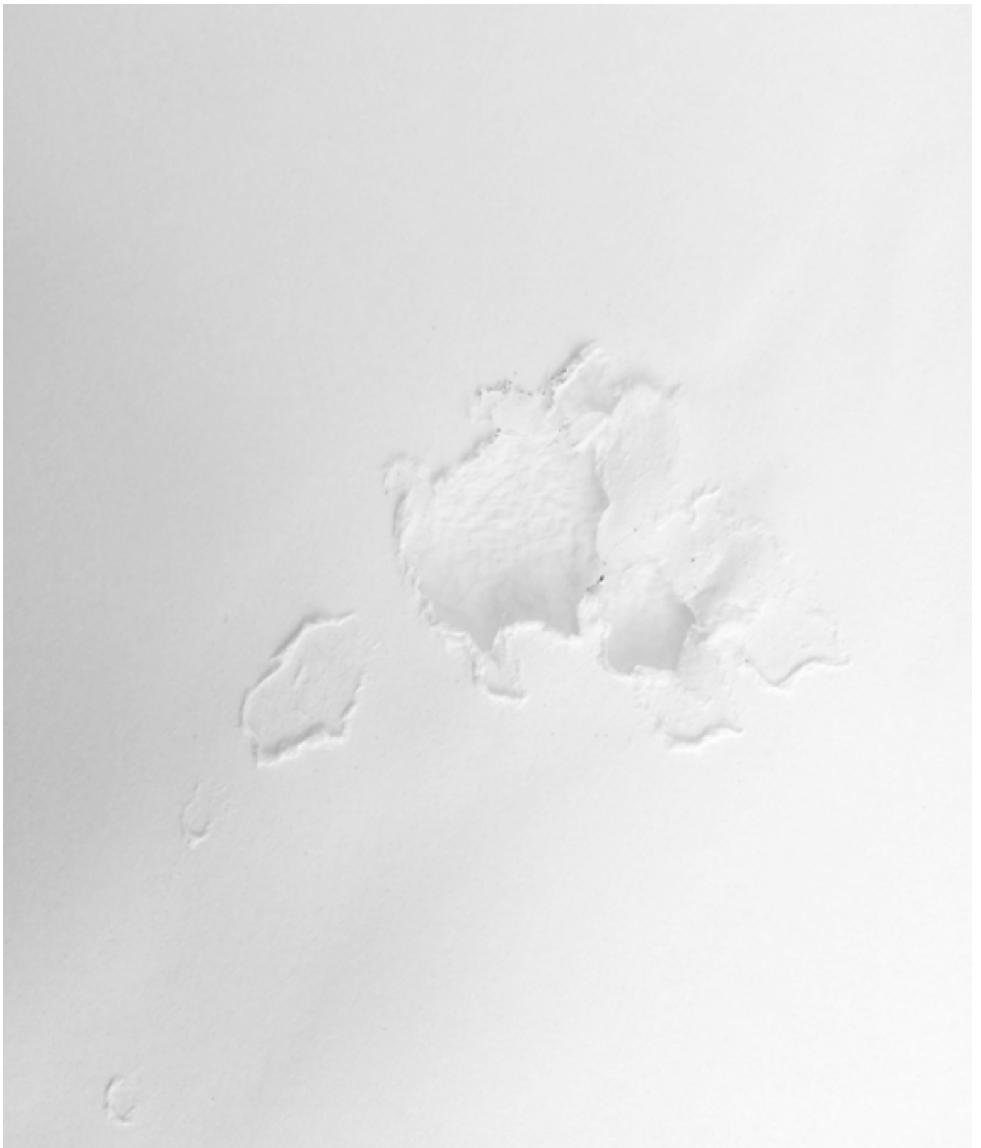
MICHELIN KOBER • LANGSAM REICHT'S • 2003/2012 Schneckenschleim, Bleistift auf Papier • 70 × 100 cm, Detail