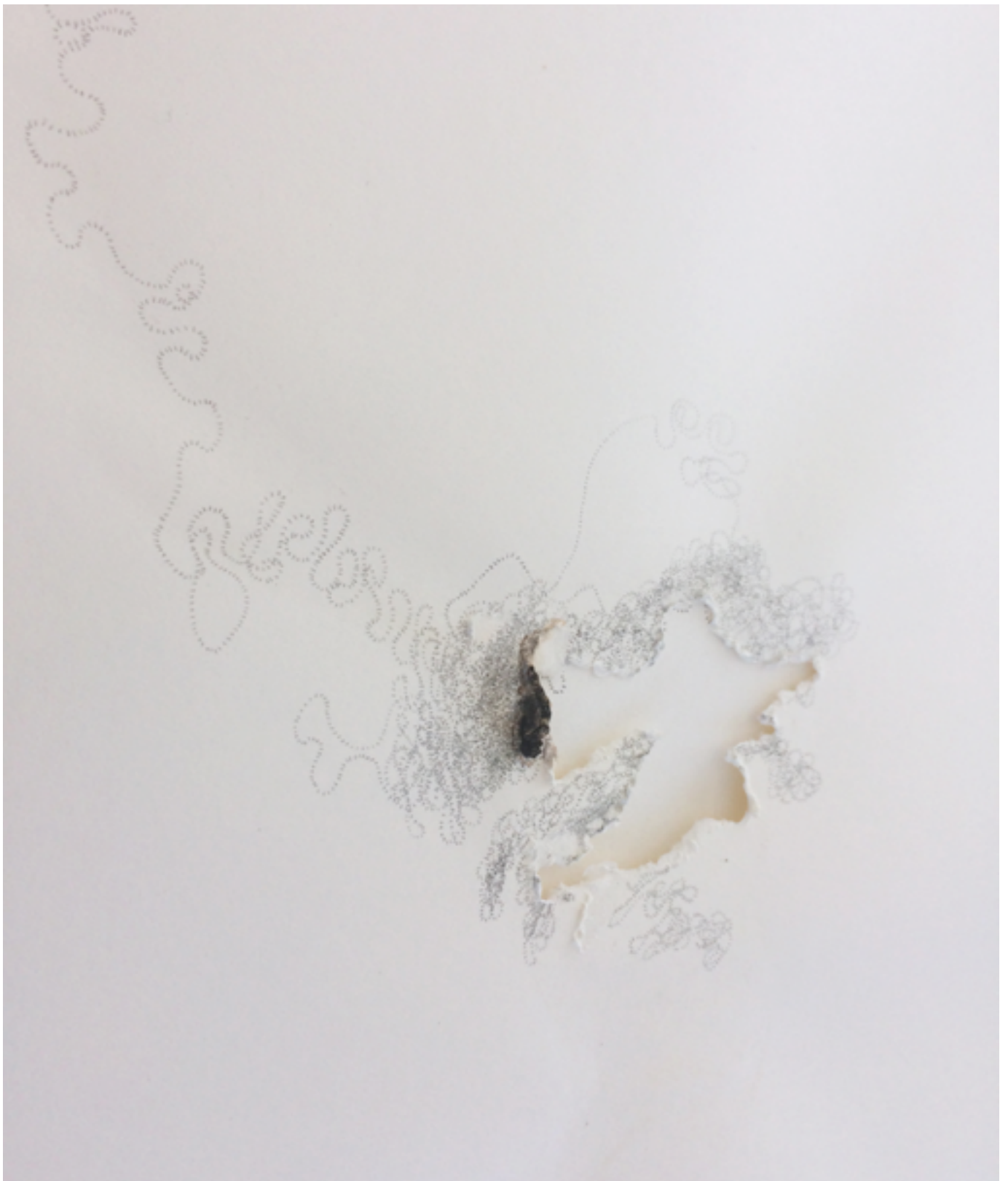
MICHELIN KOBER • LANGSAM REICHT'S • 2003/2012 Schneckenschleim, Bleistift auf Papier • 70 × 100 cm, Detail