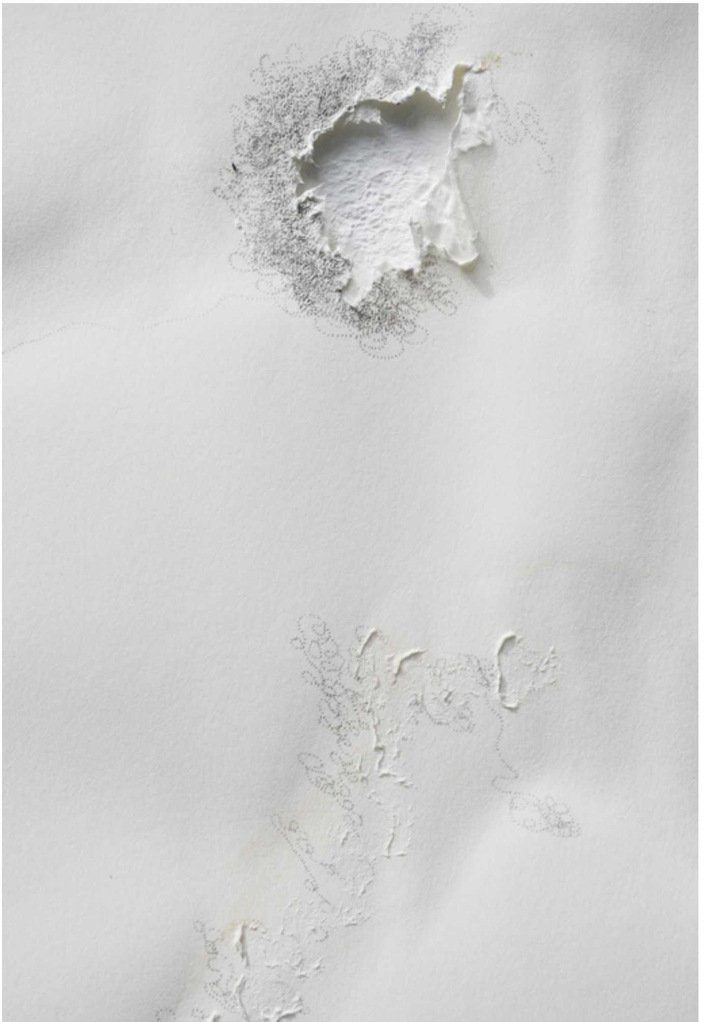
MICHELIN KOBER • LANGSAM REICHT'S • 2003/2012 Schneckenschleim, Bleistift auf Papier • 70 × 100 cm, Detail