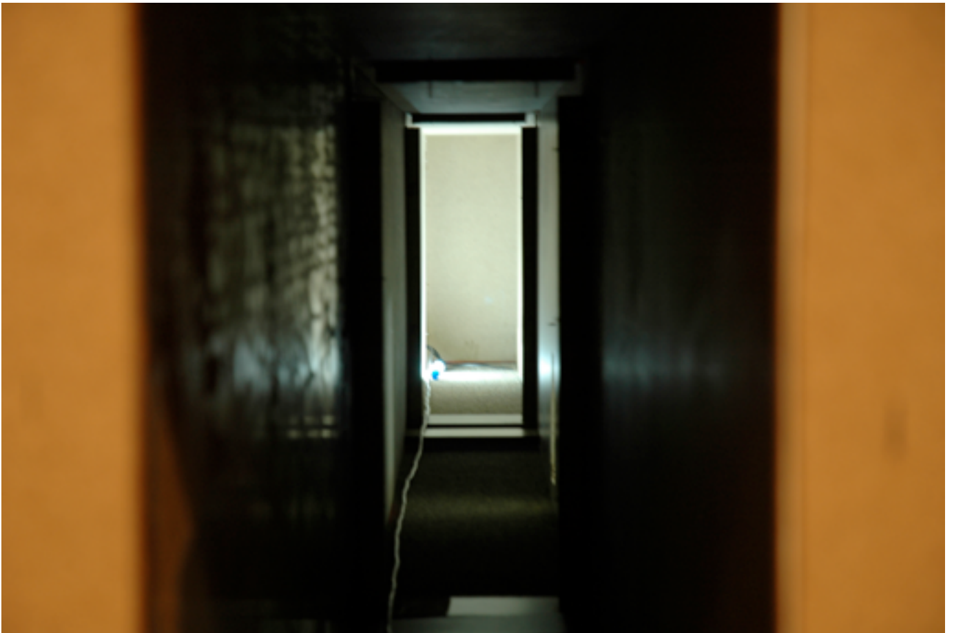
MICHELIN KOBER (MIT DANIEL MIJIC) • KÜNSTLERPAAR, MITTE 30 SUCHT... • 2005 Ausstellungsansicht Innenraum große Hausform mit Blick in Kanal