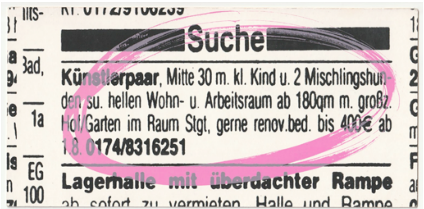
MICHELIN KOBER (MIT DANIEL MIJIC) • KÜNSTLERPAAR, MITTE 30 SUCHT... • 2005 Teppich, versch. Materialien, Licht • 22 x 8 x 4 m Einladungskarte