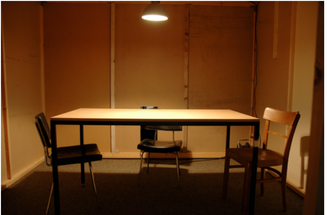
MICHELIN KOBER (MIT DANIEL MIJIC) • KÜNSTLERPAAR, MITTE 30 SUCHT... • 2005 Ausstellungsansicht Innenraum große Hausform