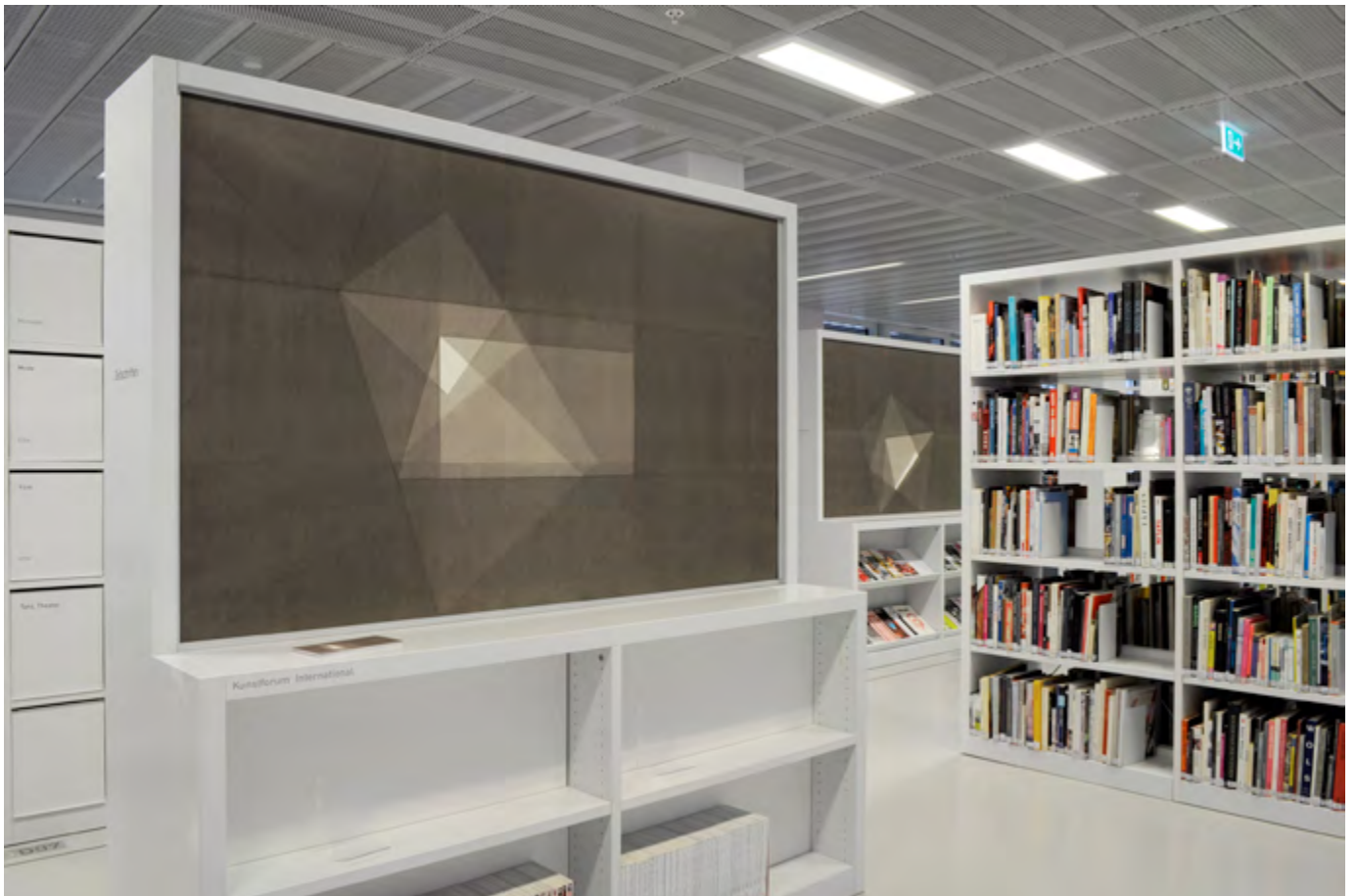
MICHELIN KOBER • FOLDING DISPLAYS • 2020 Ausstellungsansichten Stadtbibliothek Stuttgart 2020