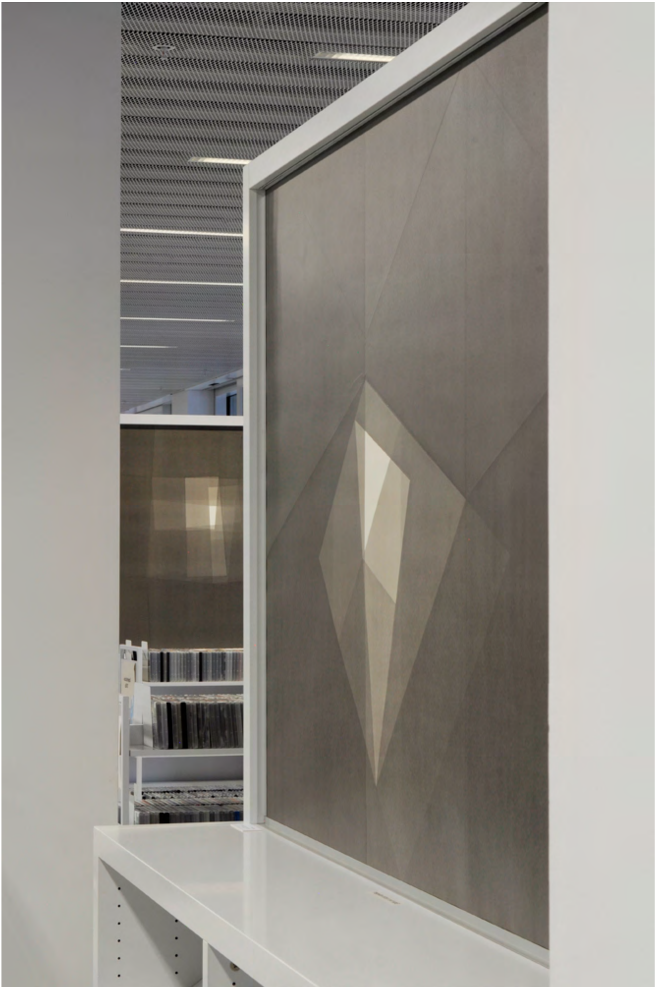
MICHELIN KOBER • FOLDING DISPLAYS • 2020 Ausstellungsansichten Stadtbibliothek Stuttgart 2020